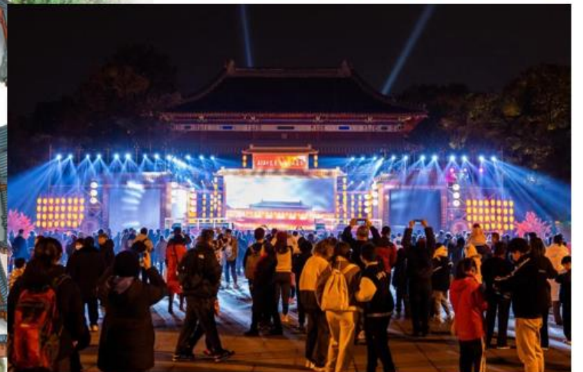
Фото новогодних ярмарок, проведенных на территории Храма Ухю